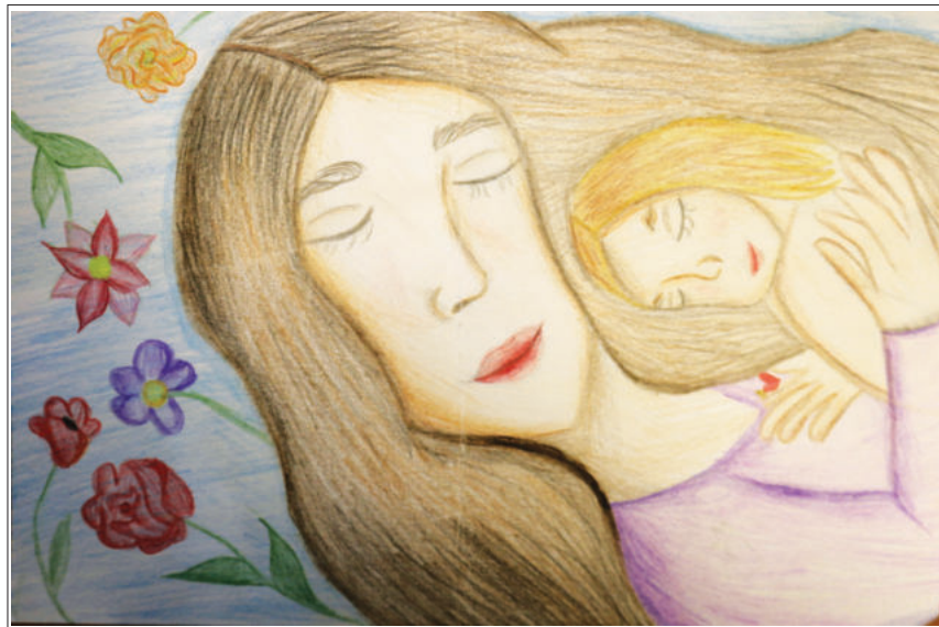
CALOTĂ Arina - Premiu special, Grupa 11-15 ani, Târgu-Jiu