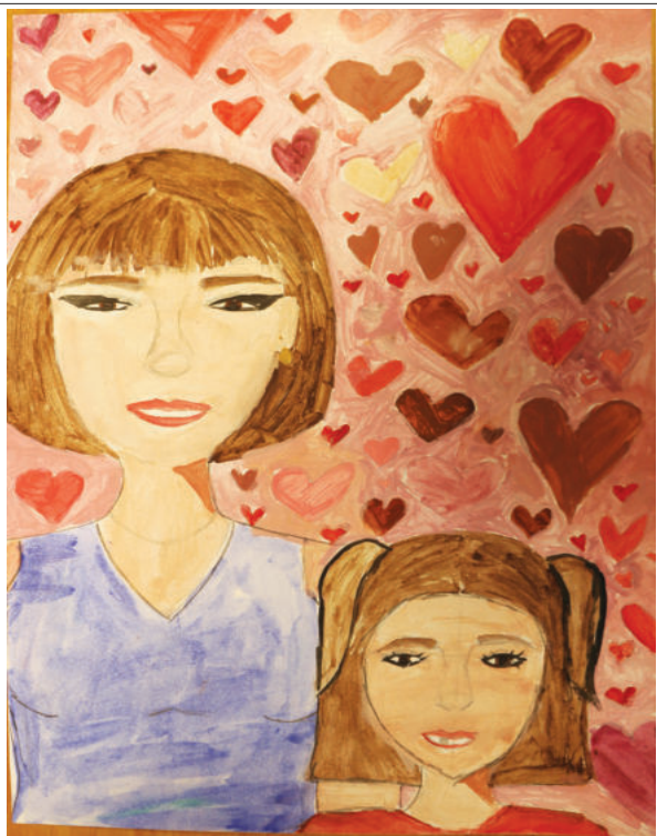
MUNTEANU Petruța Emanuela - Locul 1, Grupa 11-15 ani, Târgu-Jiu