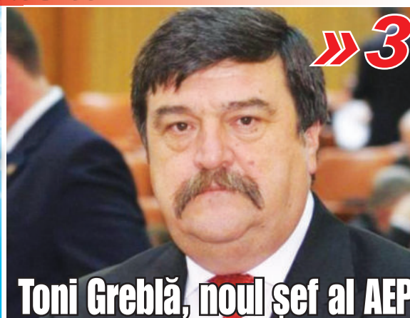
Toni Greblă, noul șef al AEP