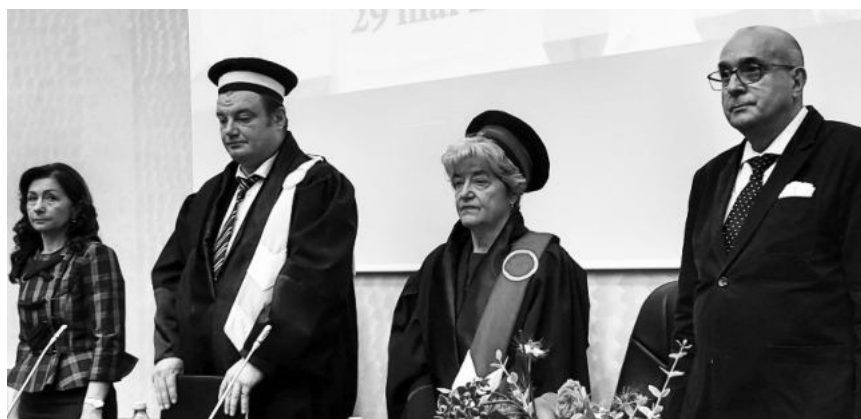
spus adevărul despre Brâncuși!