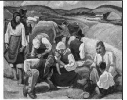
Camil Ressu - Odihnă la câmp

pământului au fost precursori și în domeniul artelor: literatură, arhitectură, arta picturală, chiar dacă n-au știut să scrie și să citească.