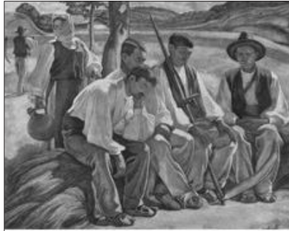
Camil Ressu - Cosași odihnindu-se

Țăranul a fost un homo religiosus, legat sufletește de biserică și mai conservator. Pentru țărani, copiii, cât de mulți, reprezentau un dar a lui Dumnezeu, ei au contribuit în cea mai mare măsură la sporul național al populației. Trăitori peste veacuri, pe lângă faptul că au fost producători de bunuri de consum, contribuind la securitatea alimentară a țării, au fost realizatori și de valori spirituale, ei au creat un bogat tezaur folcloric și etnografic, de asemenea, un patrimoniu gastronomic. Dacă vizităm muzee ale satelor, țărănești, ne dăm seama că muzeele robi ai